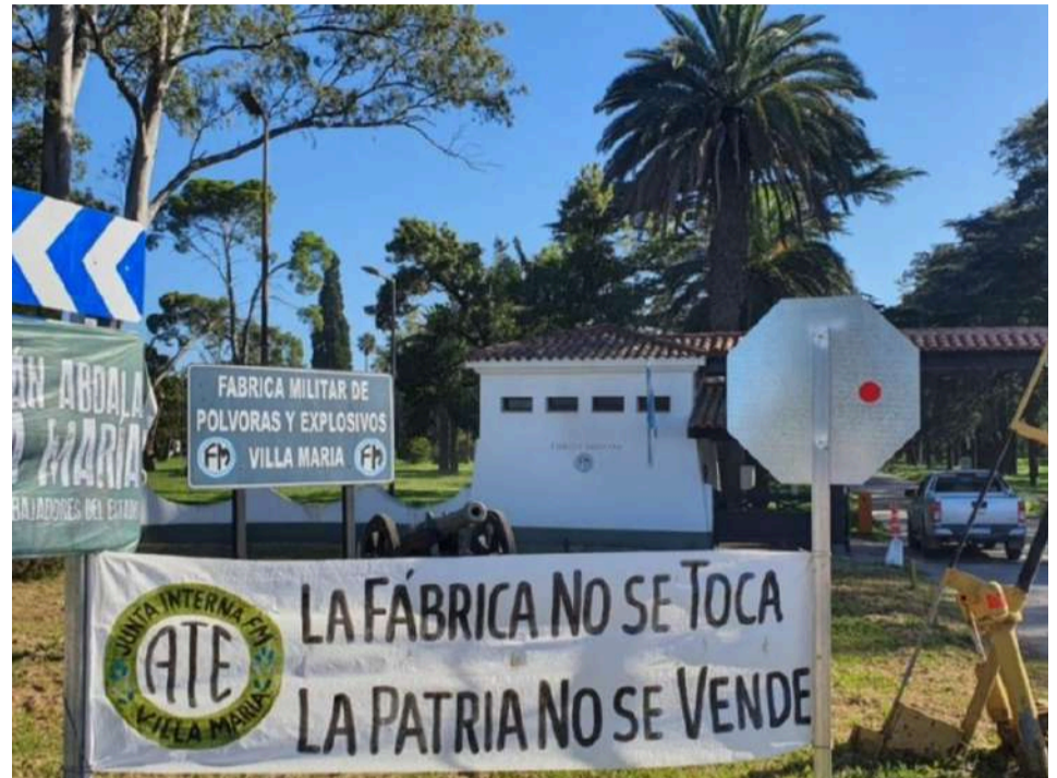
La Patria no se vende, dice el gremio.

"Fabricaciones Militares de nuestra provincia corren el riesgo de ser convertidas en Sociedades Anónimas, paso