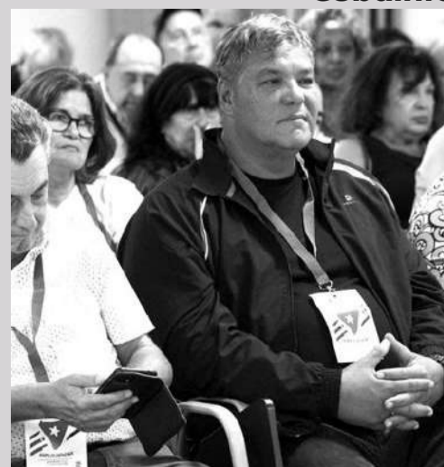
Uno de los 5 Héroes de Cuba que estuvo 16 años preso en EE UU.