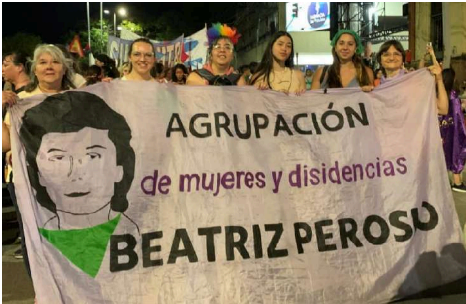
La Beatriz Perosio en el 37 Encuentro Plurinacional de Mujeres en Jujuy.

Al grito de ¡Corrientes!, próxima sede, finalizó el 37º Encuentro Plurinacional de Mujeres, Lesbianas, Trans, Travestis, Bisexuales, Intersexuales y No Binaries. Luego de tres días de talleres, debates, marchas, charlas, actividades artísticas, abrazos, risas, lágrimas y más abrazos, terminó en San Salvador de Jujuy el evento que reúne a las mujeres y diversidades de la Argentina. La ciudad que hace poco más de un año era el ensayo de autoritarismo, ajuste y represión, en estos días fue territorio tomado por los feminismos.