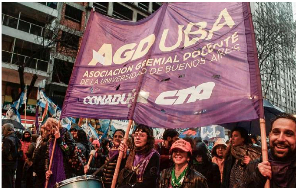
Docentes y estudiantes, unidos y adelante.