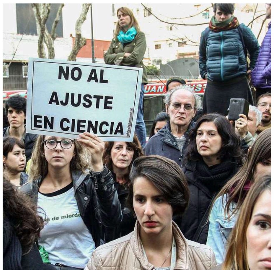
La ciencia y técnica, entre los más ajustados.