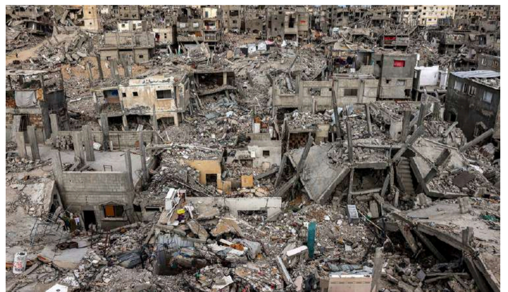
Así los sionistas han destruido a Gaza.