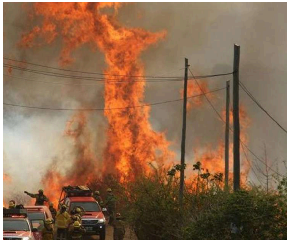
Mano del hombre y del negocio sojero e inmobiliario.