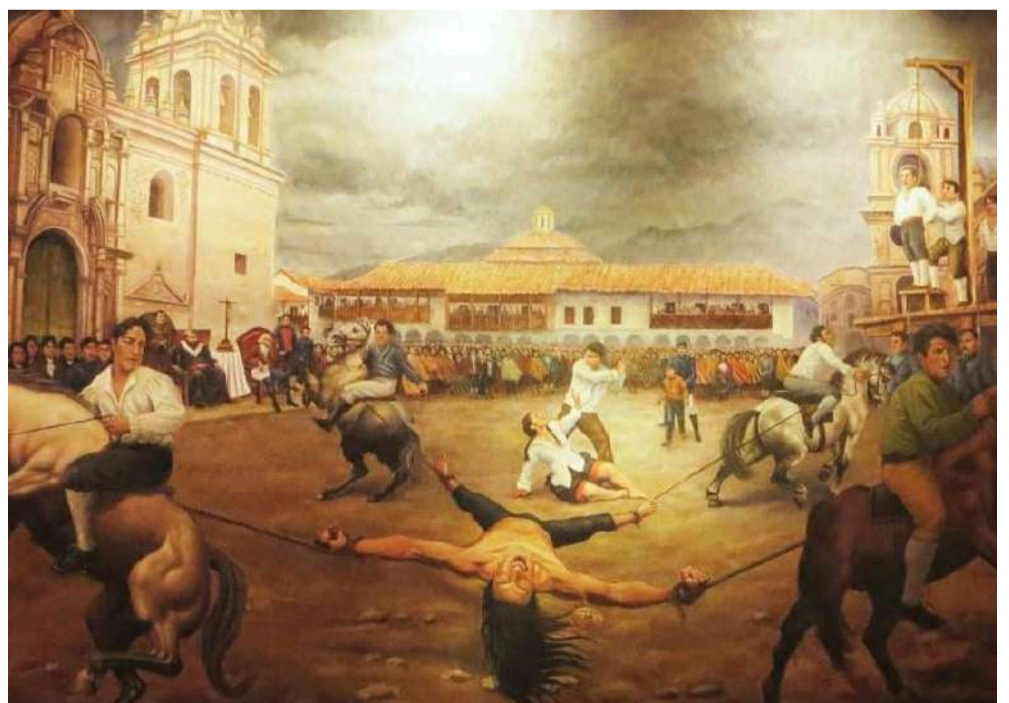
La España monárquica fue invasora y genocida.