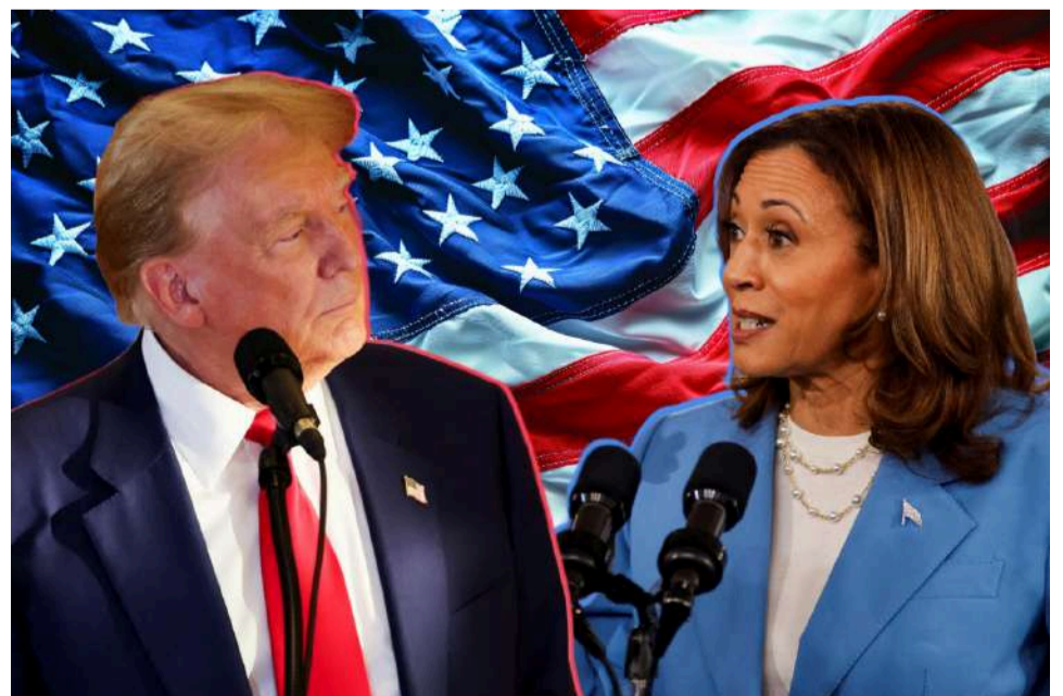
La plutocracia bipartidista.