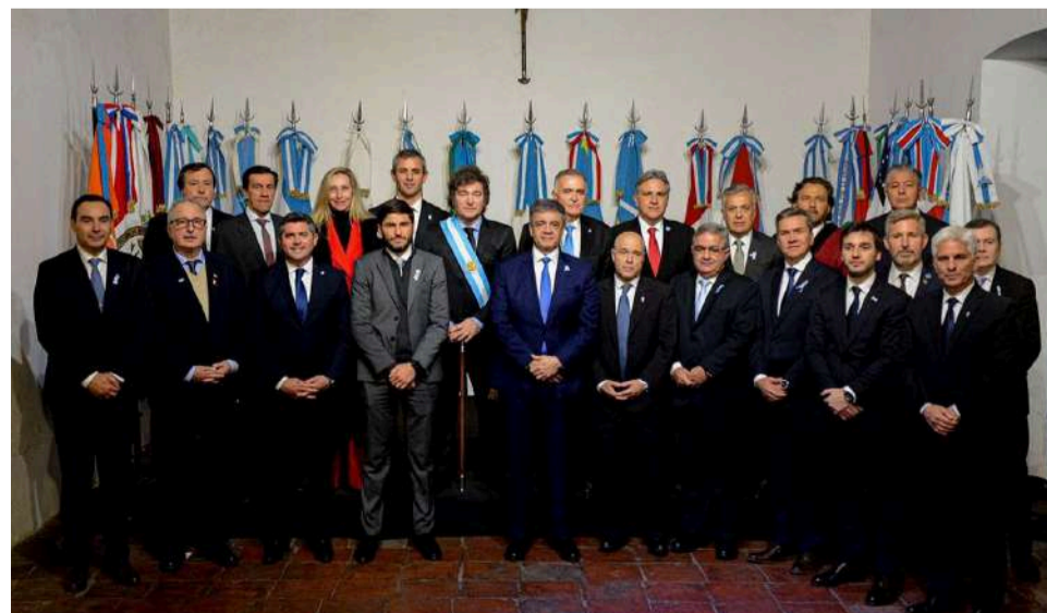
Estos 18 gobernadores son traidores a la patria.

Esas limitaciones ideológicas y políticas se ven en la práctica. Ni ella ni La Cámpora están abocados a la protesta social ni a la construcción de un frente político combativo. ¿Cambiará y será parte de una oposición en serio? Muy difícil, pero no imposible. Lo que sí no hay que ser iluso, ni aceptar su dedo ni su programa gran burgués ni sus “clases magistrales” ni esperar sus tiempos, que no son los de los compatriotas que sufren el ajuste.