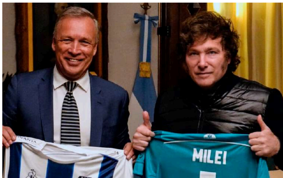
Ex presidente de la T coqueteaba con genocida Menéndez, el actual lo hace con Milei.

La semana terminó con el presidente y el dirigente de Talleres reunidos en la Casa Rosada. Quieren poner a los clubes en venta y se muestran juntos. Los hinchas se organizan para darles pelea. El conflicto va para largo en una lucha desigual donde el poder económico y su marioneta en el gobierno avanzan a paso redoblado.