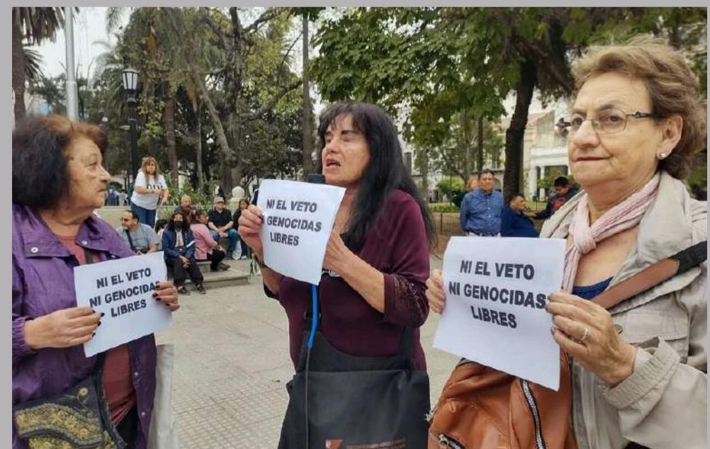
Jubiladas protestan en Salta.