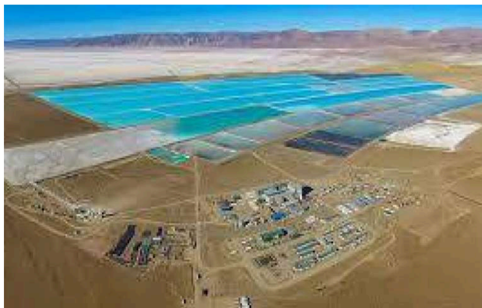
Graves peligros ambientales.